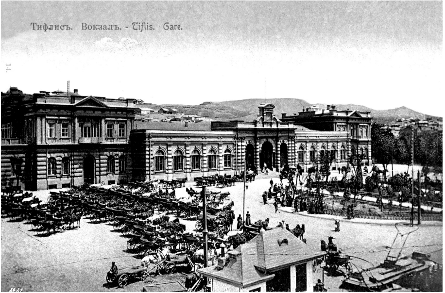
Тифлисъ. Вокзалъ. - Tiflis. Gare.

დამტოვო! არ დამტოვო!“ გია მატარებლების ბაქებიდან გამოვიდა, სიგარეტის კოლოფი ამოიღო, მაგრამ გაასხენდა, ასანთის კოლოფი რომ საკანთან დაუვარდა. ნელი ნაბიჯით მივიდა საკანთან, კოლოფი იქვე ძირს დაგდებული დაინახა, აიღო, მოუკიდა სიგარეტს და ხათუნას საკნის ფართოდ გახსნილი კარები მისურა. კარების ასაკრებ ციფრებს დააკვირდა: 197-. და მიხვდა, ბოლო ციფრს ხათუნა რატომ არ კრეფდა. გიამ მიუმატა ბოლო ციფრი “6“ და საკანი სამუდამოდ ჩაიკეტა. თბილისში 1976 წლის საშინელი ცხელი ზაფხული იდგა, გიას კი რატომღაც სციოდა.